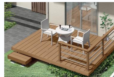
玄関からも出入り できるタイプ